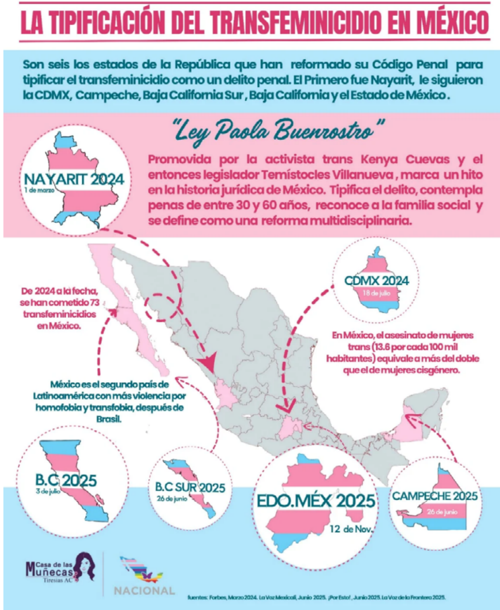
Gráfico 2. Tipificación del delito de transfeminicidio en México